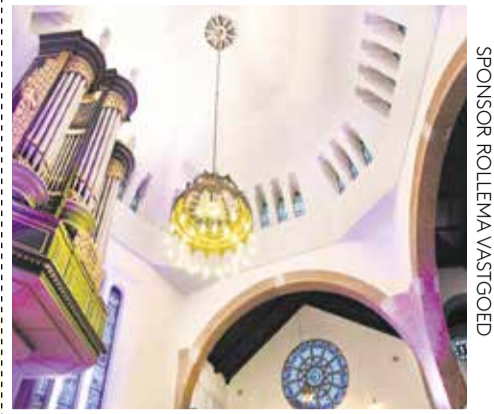
SPONSOR ROLLEMA VASTGOED

Eerst maar eens zien of de plantjes het houden.