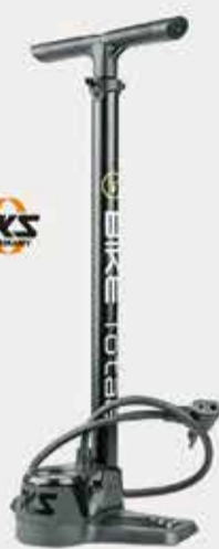
Airkompressor Compact 10.0 vloerpomp