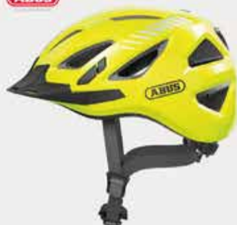
Urban-I 3.0 signal helm