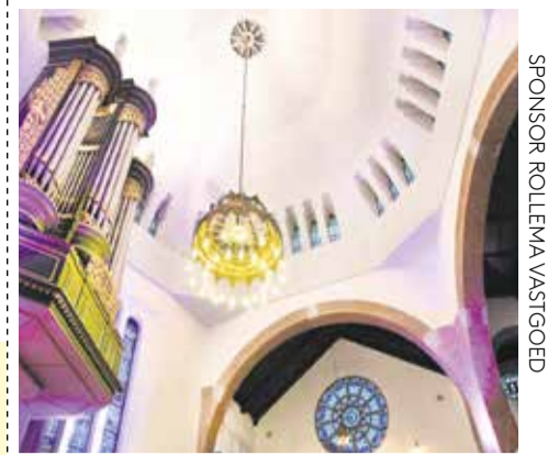
SPONSOR ROLLEMA VASTGOED